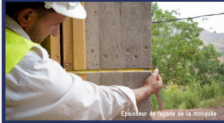
Epaisseur de façade de la mosquée