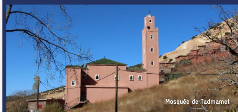
Mosquée de Tadmamet